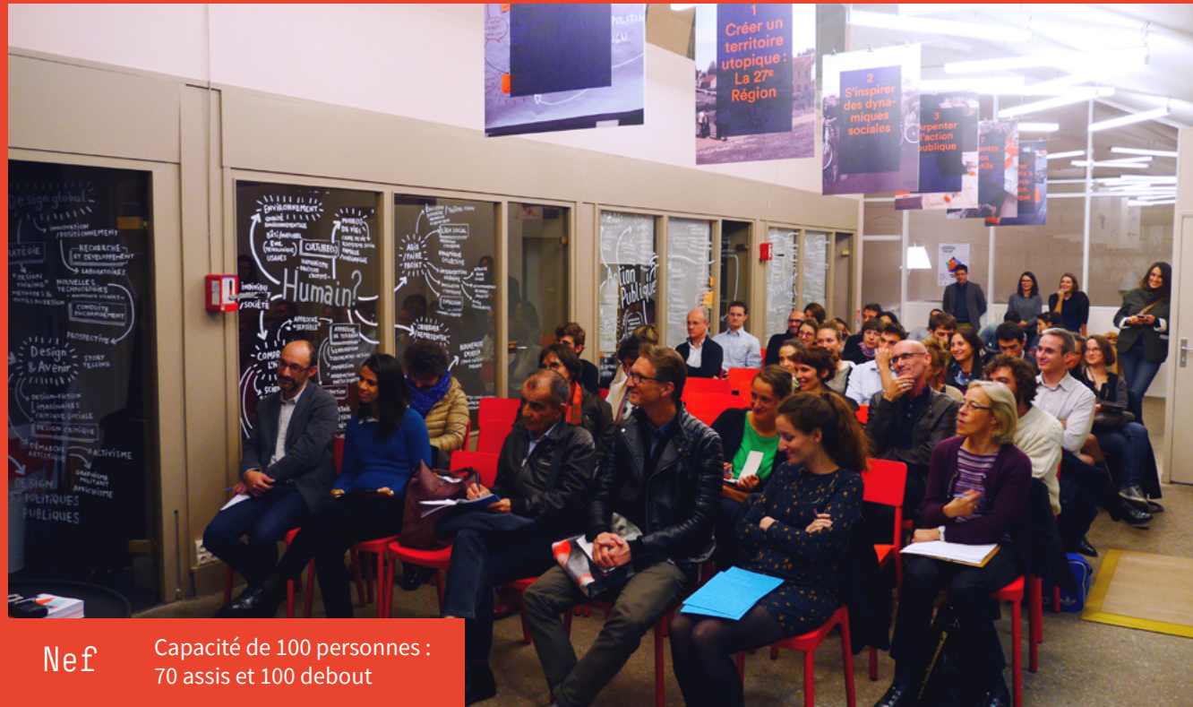
Nef Capacité de 100 personnes : 70 assis et 100 debout