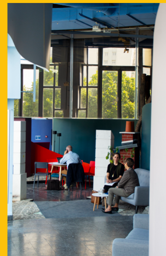
Salle de réunion la Grotte capacité de 15 personnes