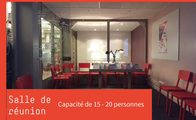
Salle de réunion Capacité de 15 - 20 personnes