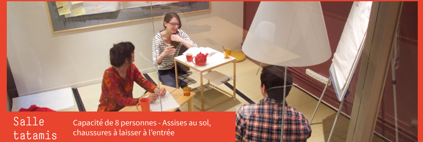
Salle tatamis Capacité de 8 personnes - Assises au sol, chaussures à laisser à l'entrée