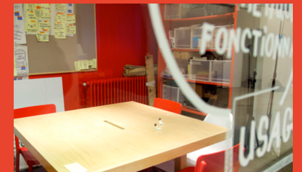
Salle Atelier Capacité de 15 - 20 personnes Studio photo disponible dans cette salle sur demande.