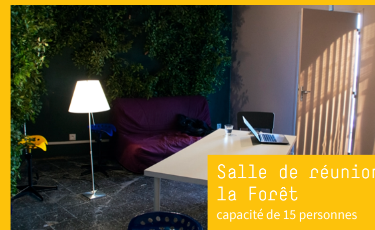
Salle de réunion la Forêt capacité de 15 personnes