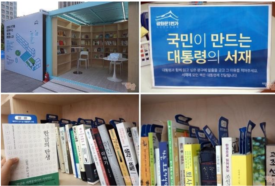
“President’s Bookshelf” installed at Gwanghwamoon 1 st St.