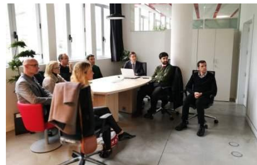
Reuniones mantenidas con representantes de Bilbao As Fabrik y otros proyectos del entorno