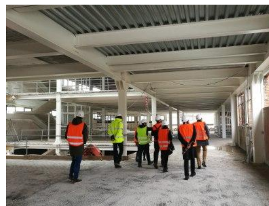
Visita al edificio Beta 2, futura sede de Bilbao As Fabrik