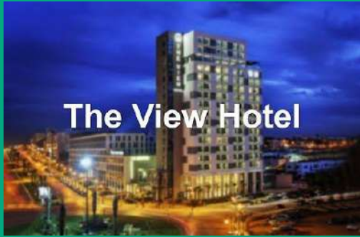
The View Hotel